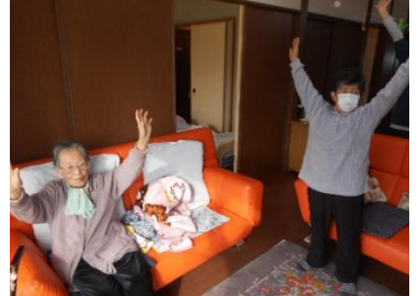
ペットボトル体操