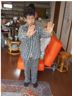
今日は立って体操するわ