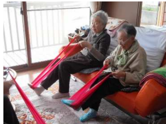
体動かすと温まるわ～