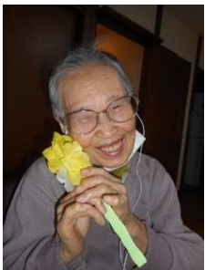
いいがになったわ～

お花紙を使って菜の花、広告で蝶を作りました。蝶の折り目や花びらを切る作業など細かい作業が多かったのですが、休憩をとりながらみんなで作り、広大会にも春が来ました! 完成した菜の花と一緒にパチリ