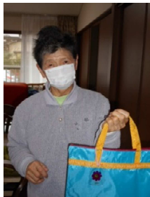
ここに寄せてもらっ たら結構な渦やわ~