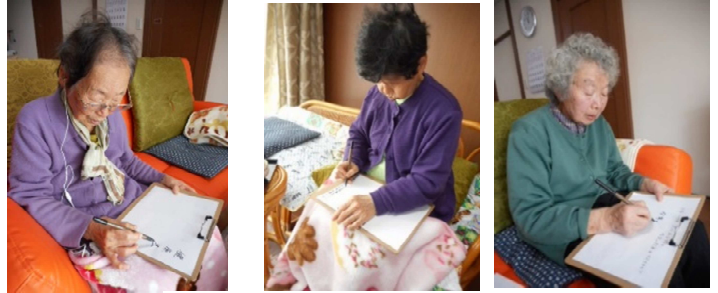
間違えんようにかかんなんねー

広大舎に元気で通い、健康で過ごしたいという願いが書かれていました。 今年一年皆様と楽しいことをみつけて、笑顔溢れる年になりますように☆