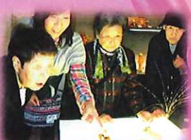
伝統工芸にうっとり...