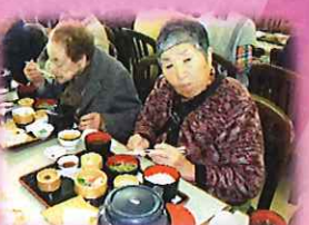
お昼御飯にも笑みが...