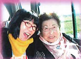
車窓からはキレイな紅葉が!