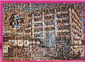
合同作品のモザイクアートも 滑り込みで完成しました!!