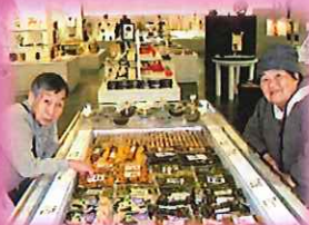
お土産選びもぬかりなし!