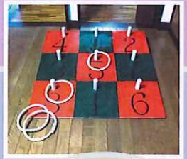
輪投げコーナー 小さい子達が 何度も挑戦しました

太子の家かがでは、今年初めて祭りに 出店する事ができました これも町民の方や実行委員の方 にご協力戴いたお蔭です 感謝申し上げます