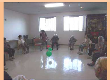
ミュージックケア