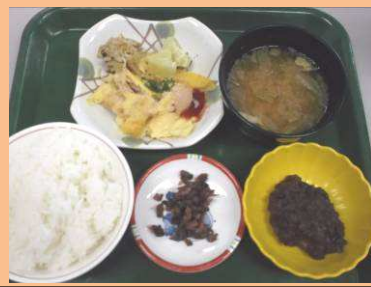
おはぎ秋分メニュー